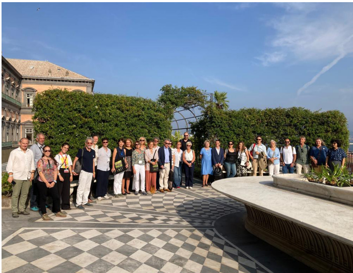
Giardini pensili di Palazzo Reale

Da venerdì a domenica si sono svolte diverse visite tecniche e culturali organizzate da AIAPP. Dai Giardini pensili di Palazzo Reale a Napoli, all'Orto Botanico, dalla prestigiosa Villa Rosebery, ai giardini della Reggia di Caserta. La cena di gala di IFLA EU si è tenuta nella suggestiva location di Made in Cloister mentre domenica si è tenuta l'emozionante visita ad Anacapri con la camminata negli olivi storici dell'isola, sapientemente recuperati dall'Associazione l'Oro di Capri.