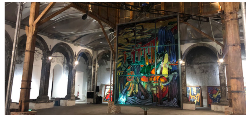
Fondazione Made in Cloister