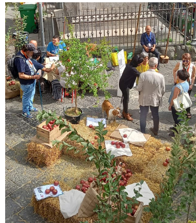
Piazza San Gaetano | Limbic di Collettivo "Janara Felix": Paesaggisti di Uptown Muse + Associazione Solaris Odv