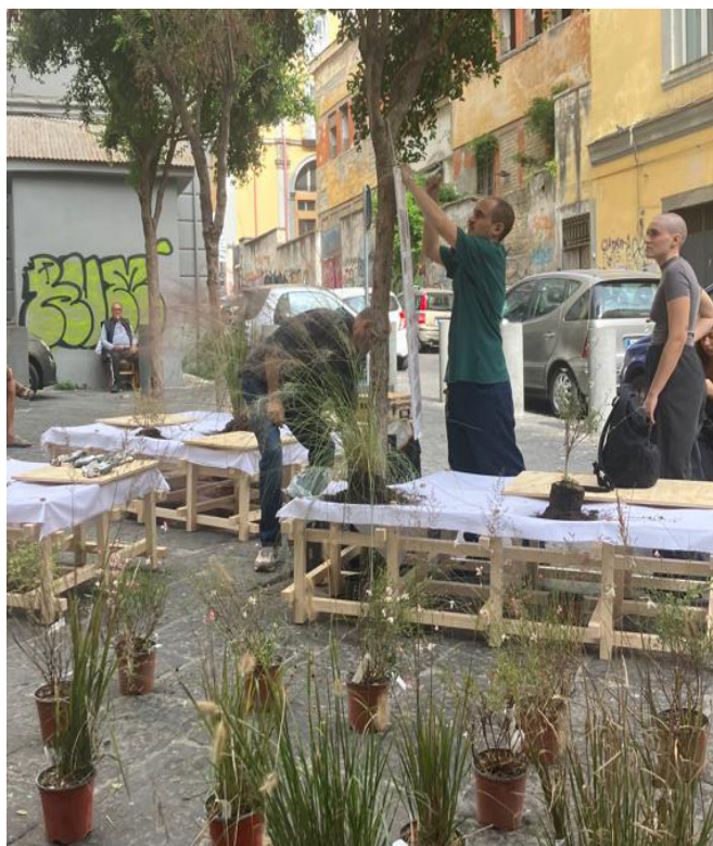
Piazzetta Giustino Fortunato | Terra su tela di Domenico Guida