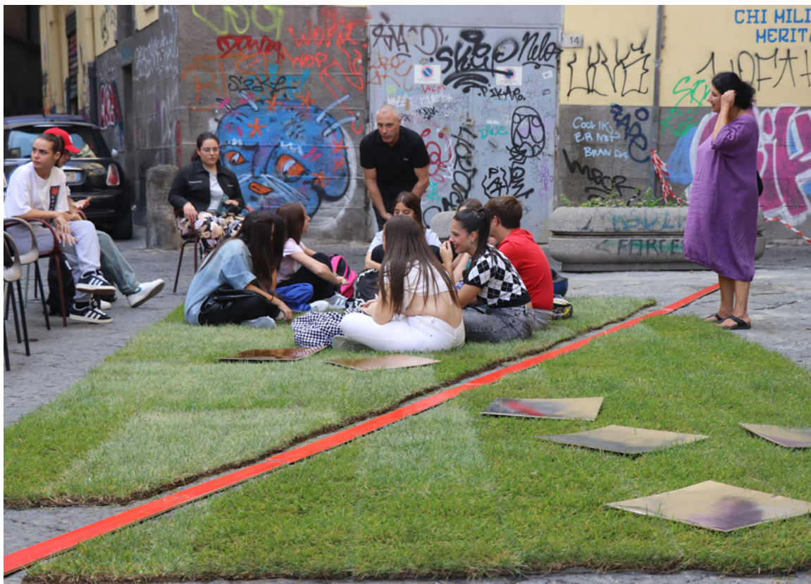
Largo San Marcellino | Cosmogonia di Giovanni Laganà

L'iniziativa ha ricevuto il patrocinio del Dipartimento di Architettura dell'Università Federico II e dell'Amministrazione del Comune di Napoli con il supporto di Giorgio Tesi Group.