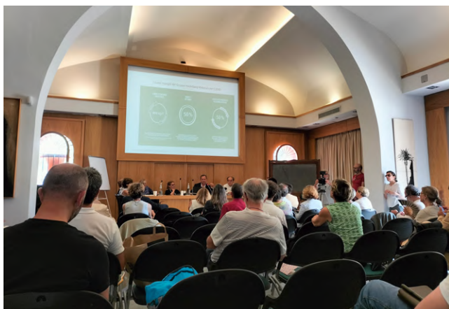
Evento co-organizzato con