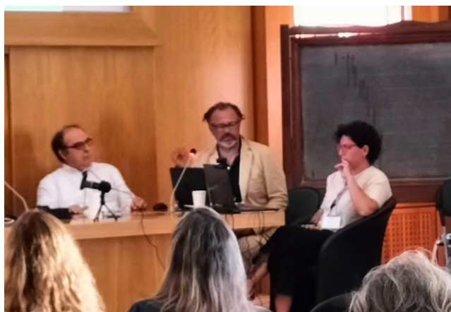
Con la partecipazione di