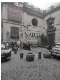
Piazzetta San Biagio