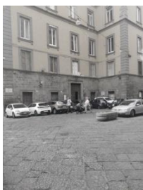
Largo San Marcellino