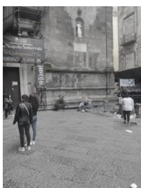
Piazza San Gaetano