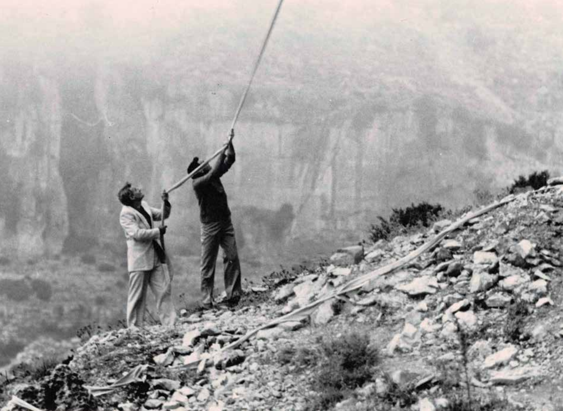
Legarsi-alla-montagna, 1981 photo Virgilio Lai (fonte: www.arte.it / Archivio Maria Lai)

della dimensione temporale, mettendo in connessione il presente dell'azione performativa con il passato della storia evocata dalla leggenda. Non solo. Compiuto in un simbolico giorno dell'anno, quell'8 settembre che nella memoria degli italiani (ancora allora) richiamava la data dell'annuncio dell'armistizio firmato nel 1943 da Badoglio con le forze alleate e l'inizio della Resistenza, Legarsi alla Montagna si configurava come un atto poetico e profondamente politico che intendeva porre interrogativi sul significato di concetti come comunità, coesistenza, appartenenza, vita in comune, memoria culturale, spazio aperto pubblico del quotidiano.