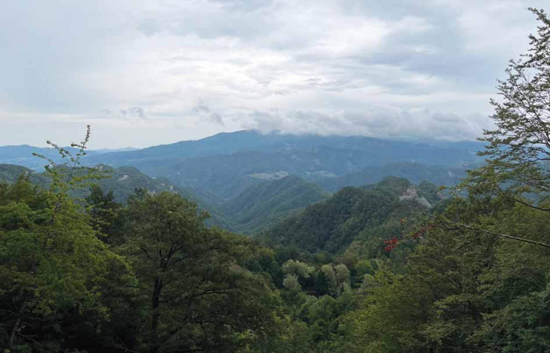
Montagne di mezzo. Appennino tosco-romagnolo, nei pressi del Passo dei Mandrioli (1173 metri s.l.m.)

ca ipogea rimasta incompiuta allo scoppio della Grande Guerra”, funziona oggi come eloquente dispositivo narrativo, che intende sollecitare anche il visitatore più distratto a fare esperienza paesaggistica di un luogo, di un territorio e della sua storia, “fatta di distruzioni, avvicendamenti, riconquista da parte della natura dei paesaggi che furono un giorno la prima linea della guerra” 14 . Attraverso progetti/processi di progettazione paesaggistica, infrastrutture post-belliche in abbandono, luoghi in attesa, spazi post-produttivi ad alta quota possono così essere riattivati e resi nuovamente accessibili ( in situ, in visu ) con la definizione di percorsi esplorativi e itinerari conosciuti. Ci sono brani di paesaggio di montagna che più di altri appaiono interrogabili come archivi viventi di memoria: da quella vertiginosa del tempo profondo, geologico, preistorico, a quella fragile dei tempi intrecciati delle vicende umane, della Storia e delle storie di vita, anche tragiche, di comunità e individui.