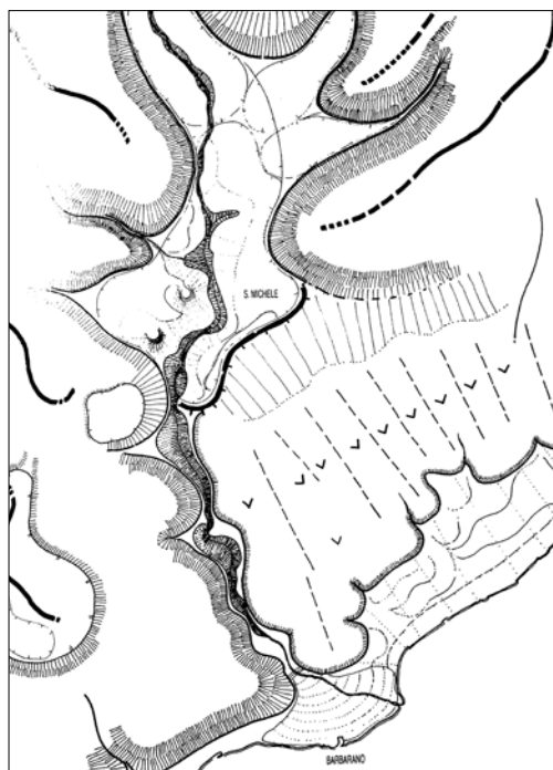
Carta della semiologia naturale / 1988 - Stralcio